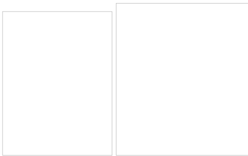
Пример № 1 (Наименование: Арматура)