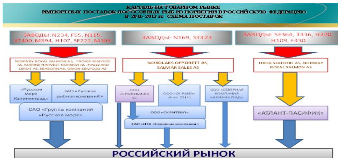
Схема № 1

Целью данного соглашения являлось устранение конкуренции на данном рынке путем фиксации долей его участников и закрепления за каждым из них определенного состава норвежских продавцов и производителей (заводов).