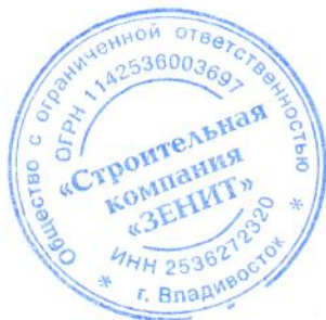
Р. С. Засеев