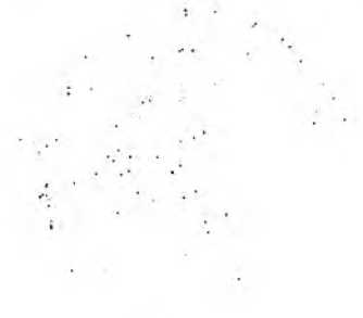
Figure 1: A schematic diagram showing the relationship between the central data point and the various components of the system.

In the second section, the author details the various methods used to collect and analyze the data. This includes the use of specialized software for data entry and the application of statistical techniques to identify trends and anomalies. The goal is to provide a comprehensive overview of the current state of the project.