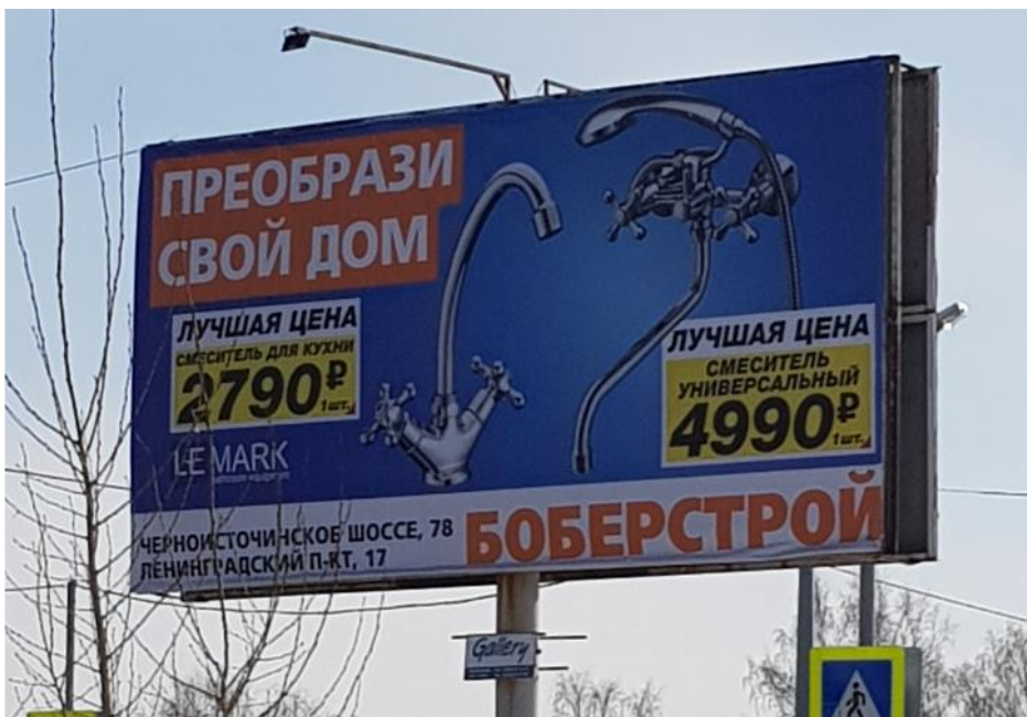
Фото №4, адрес местонахождения рекламной конструкции: Свердловская обл., г. Нижний Тагил, напротив магазина «Лидер», Черноисточинское шоссе, д.28.

Заявитель полагает, что реклама, расположенная на фото №1,2,3,4, является наружной рекламой, в которой присутствует характеристика объекта рекламы со словосочетанием «лучшая цена», что является нарушением положений п.4 ч.3 ст.5 Закона о рекламе.