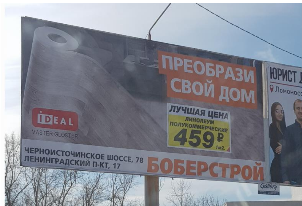
Фото №1, адрес местонахождения рекламной конструкции: Свердловская обл., г. Нижний Тагил, ул. Ломоносова, д.4.

использование словосочетания «лучшая цена» в рекламе компании «Бобёрстрой» на рекламных щитах, размещенных в г. Нижний Тагил (представлены на фото ниже):