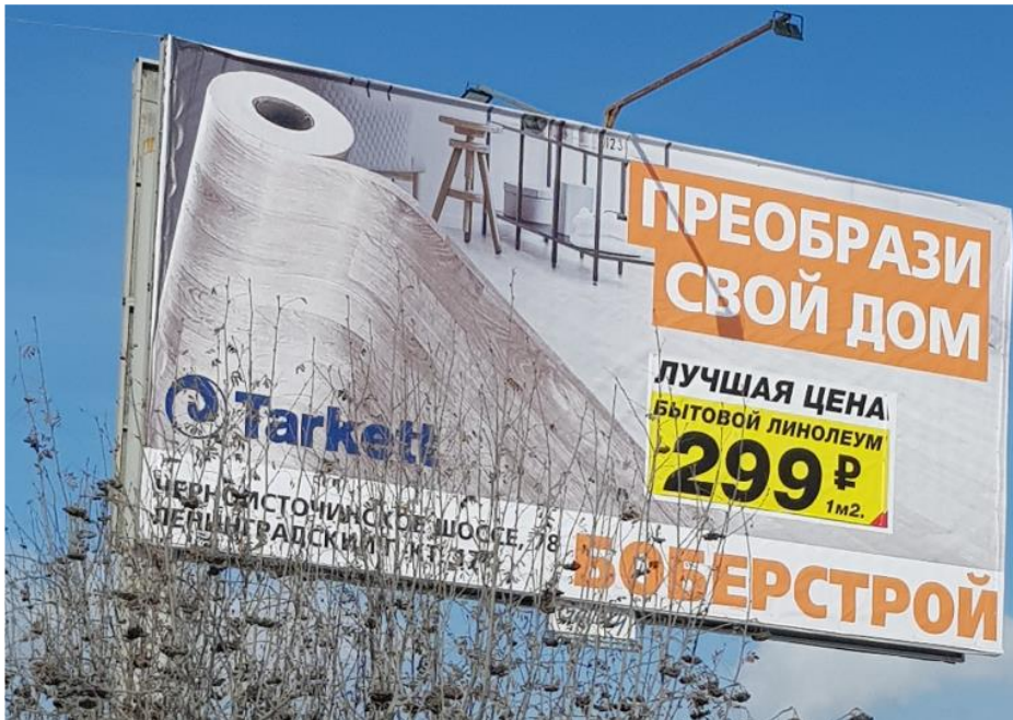
Фото №3, адрес местонахождения рекламной конструкции: Свердловская обл., г. Нижний Тагил, напротив магазина «Лидер», Черноисточинское шоссе и Большая Гальянская ул., координаты 57.886055,59.940818.