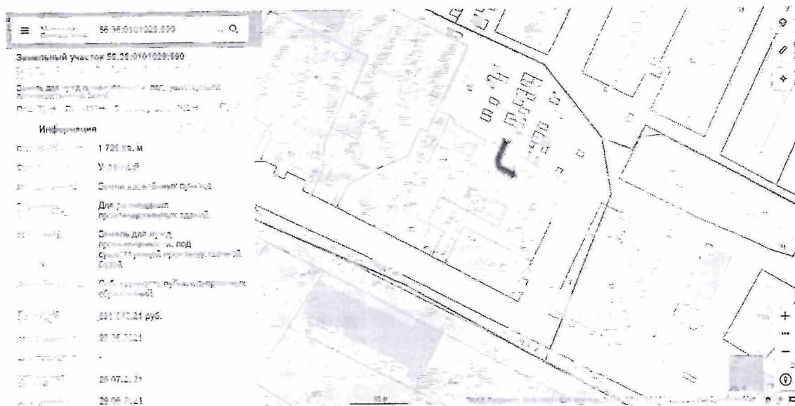
Скриншот публичной кадастровой карты. Стрелкой показан единственно возможный заезд к зданию заявителя

Далее Постановлением администрации муниципального образования Бузулукский район от 18.08.2021 №728 -п «О проведении аукциона на право заключения договоров аренды земельных участков» в отношении данного участка с кадастровым номером 56:38:0101029:690 назначены торги на право заключения договора аренды сроком на 5 лет, извещение о проведении торгов на площадке torgi.gov № 200821/38719791/01, Лот № 5.