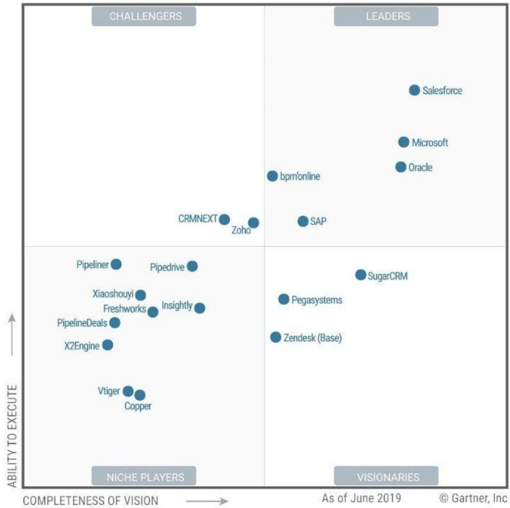
Figure 1. Magic Quadrant for Sales Force Automation