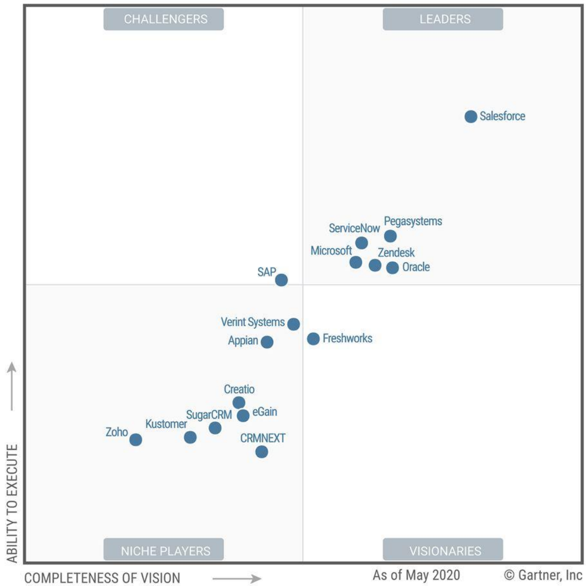
Figure 1. Magic Quadrant for the CRM Customer Engagement Center