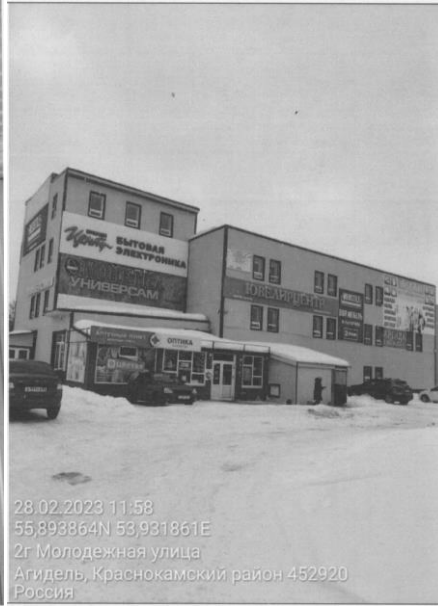
28.02.2023 11:58 55,893864N 53,931861E 2г Молодежная улица Агидель, Краснокамский район 452920 Россия