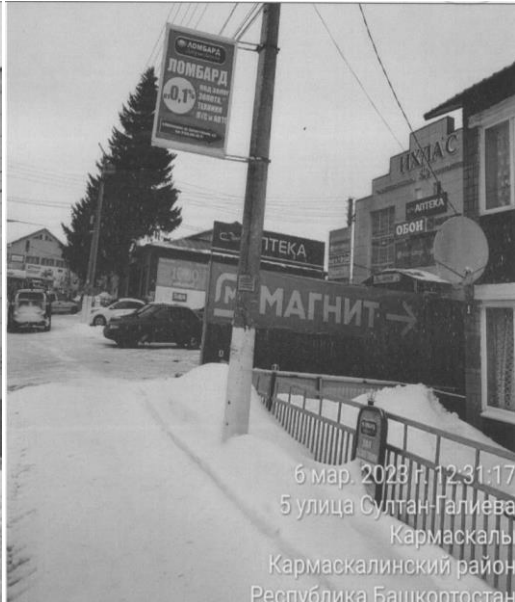
6 мар. 2023 г. 12:31:17 5 улица Султан-Галиева Кармаскалы Кармаскалинский район Республика Башкортостан