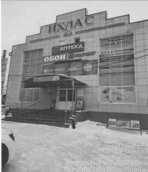
6 мар. 2023 г. 12:31:49 5 улица Султан-Галиева Кармаскалы Кармаскалинский район Республика Башкортостан