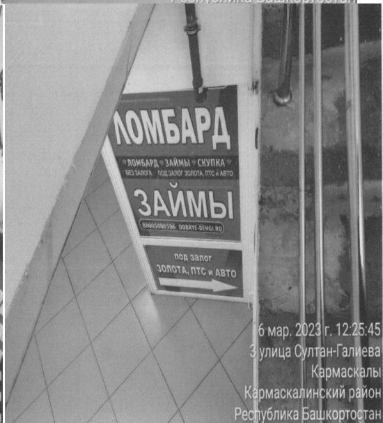
6 мар. 2023 г. 12:25:45 3 улица Султан-Галиева Кармаскалы Кармаскалинский район Республика Башкортостан