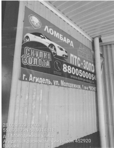
28.02.2023 12:03 55,893879N 53,931481E д.1 Молодежная улица Агидель, Краснокамский район 452920 Россия