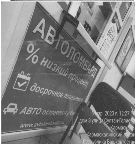
6 мар. 2023 г. 12:27:16 дом 3 улица Султан-Галиева Кармаскалы Кармаскалинский район Республика Башкортостан