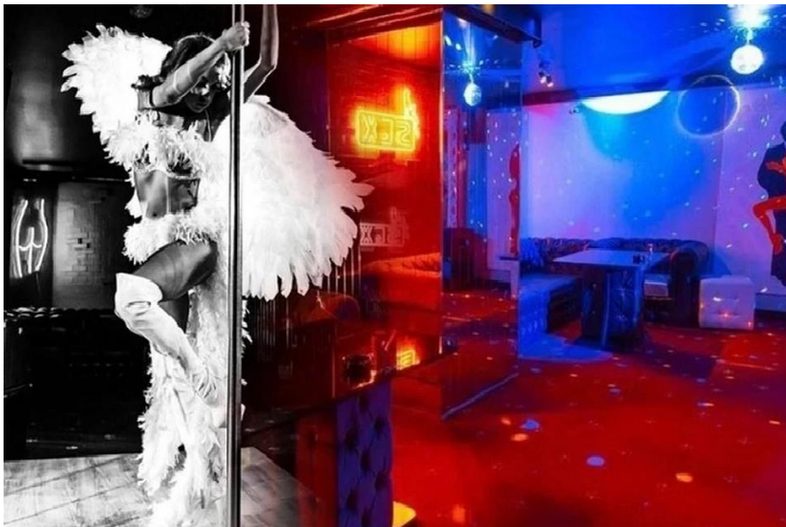
Ночной клуб занимается благотворительностью уже 5 лет.

В Екатеринбурге мужские клубы – это не только шоу для взрослых, но и благотворительность. «Комсомолка» уже рассказывала про клуб, к дверям которого регулярно подбрасывают бездомных животных. То котят в коробках оставляют, то собачку принесут. Дошло до того, что один из постоянных клиентов заведения даже подарил им дом для того, чтобы они смогли организовать там приют четвероногим.