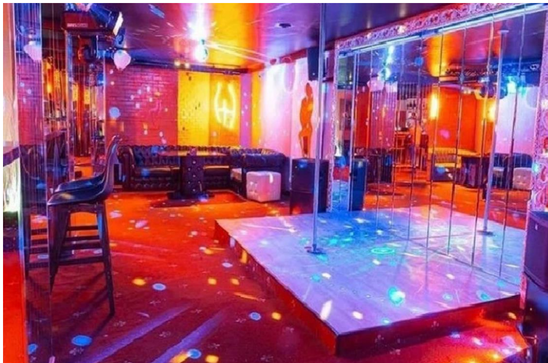
После коронавируса люди стали охотнее тратить деньги на благотворительность.

В Екатеринбурге мужские клубы – это не только шоу для взрослых, но и благотворительность. «Комсомолка» уже рассказывала про клуб, к дверям которого регулярно подбрасывают бездомных животных. То котят в коробках оставляют, то собачку принесут. Дошло до того, что один из постоянных клиентов заведения даже подарил им дом для того, чтобы они смогли организовать там приют четвероногим.